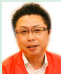
株式会社浜野製作所 代表取締役社長