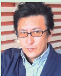
NPO 法人ワップフィルム 理事長・映画監督