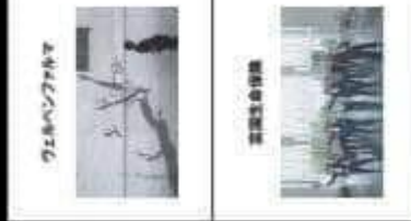
ワイルドワンダー