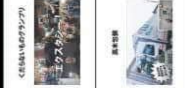
くららいものグランプリ