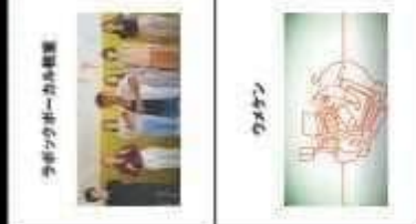
ラベックホールから見える